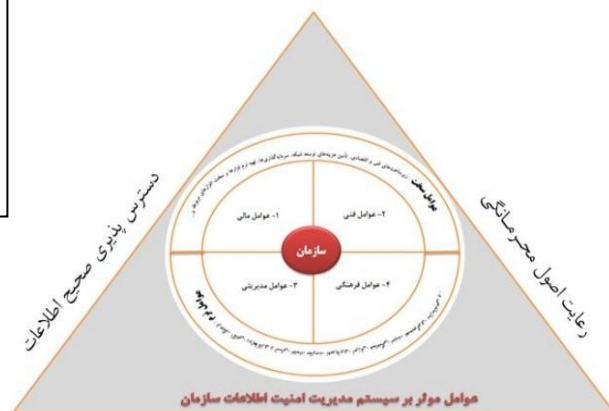
شکل ۱- مدل مفهومی پژوهش، عوامل‌های نرم و سخت موثر بر سیستم مدیریت امنیت

در این پژوهش با توجه به مبانی نظری و پیشینه مطالعات صورت گرفته و مصاحبه با متولیان امر و محدودیت‌های محقق در سازمان مورد نظر، عوامل نرم موثر بر سیستم مدیریت امنیت اطلاعات در قالب دو دسته کلی عوامل فرهنگی/اجتماعی و عوامل مدیریتی و عوامل سخت نیز در دو دسته، عوامل فنی/فناورانه و عوامل مالی طبقه‌بندی شده‌اند. شکل ۱ مدل مفهومی این پژوهش را نشان می‌دهد.